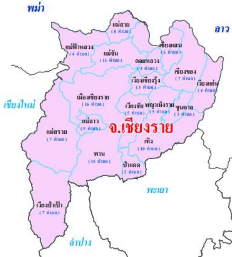
ภาพที่ 8 แผนที่แสดงอำเภอในจังหวัดเชียงราย